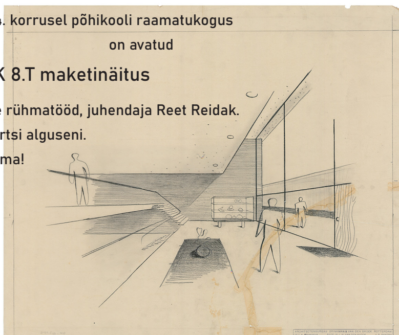
Van den Broek en Bakema. Winkelinterieur De Lijnbaan, Rotterdam, 1948–1953.