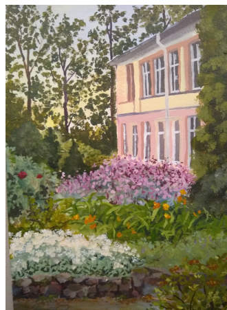
Eleanor Pihlak, 12.K