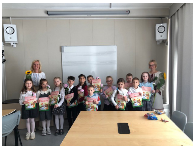
Ukraina õpilaste 1. klass