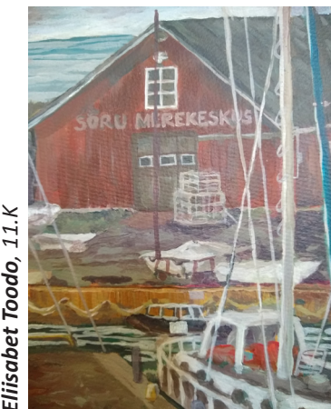
Eliisabet Toodo, 11.K