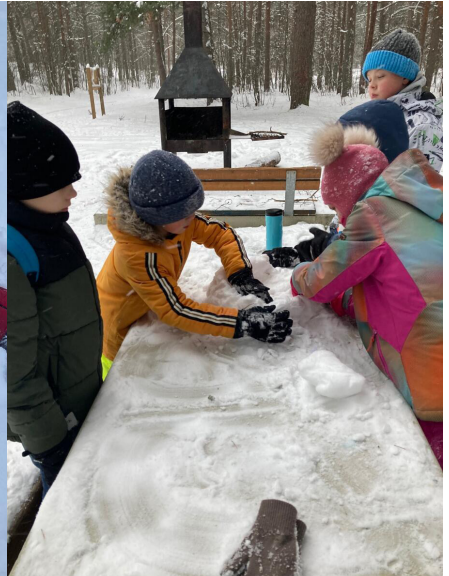
3.A, 3.B koostöös