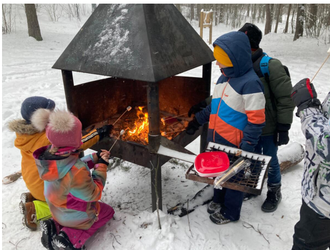
3.A, 3.B lõkke ääres