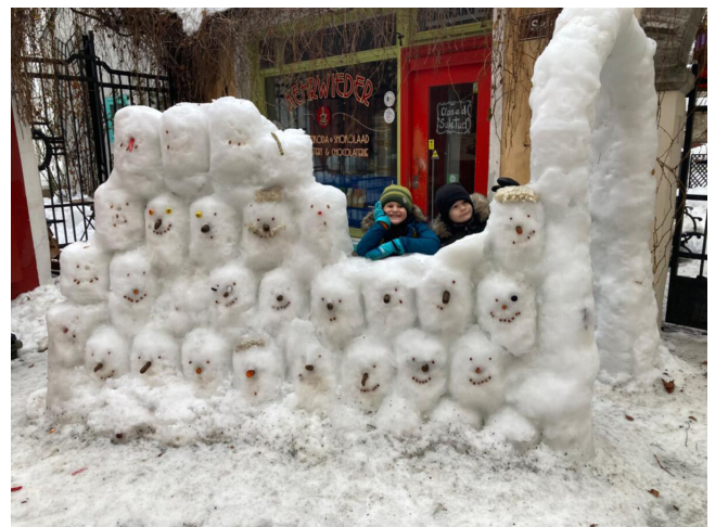
1.B tagasi linnas