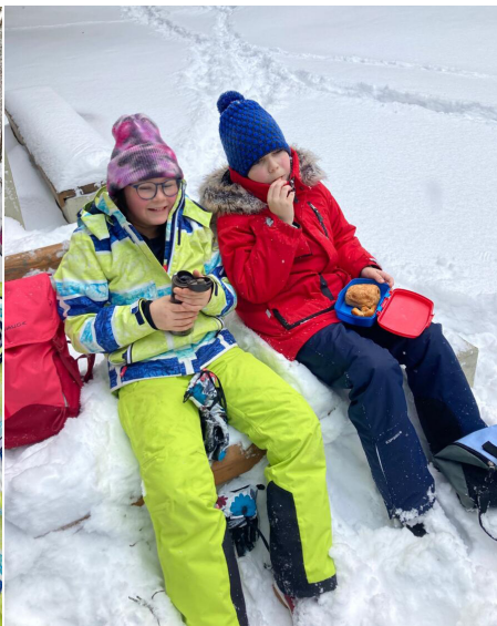
4.B, 4.C metsapiknikul