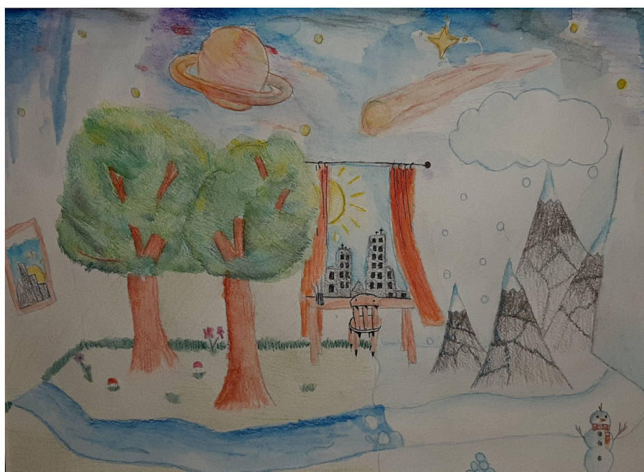
"Maailm kodus", Simona Rehepapp, PMK 4.T

Vanematekogu 14.04.21 2 8. klassi arvamused... 2-3 Autoportreid..... 3 Õnnitleme..... 4 Loovtöid..... 4