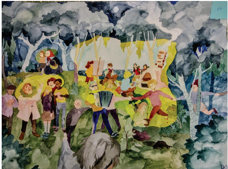
Dora Grentsi võistlustöö kunstiolümpiaadi piirkonnavoorus (III koht)