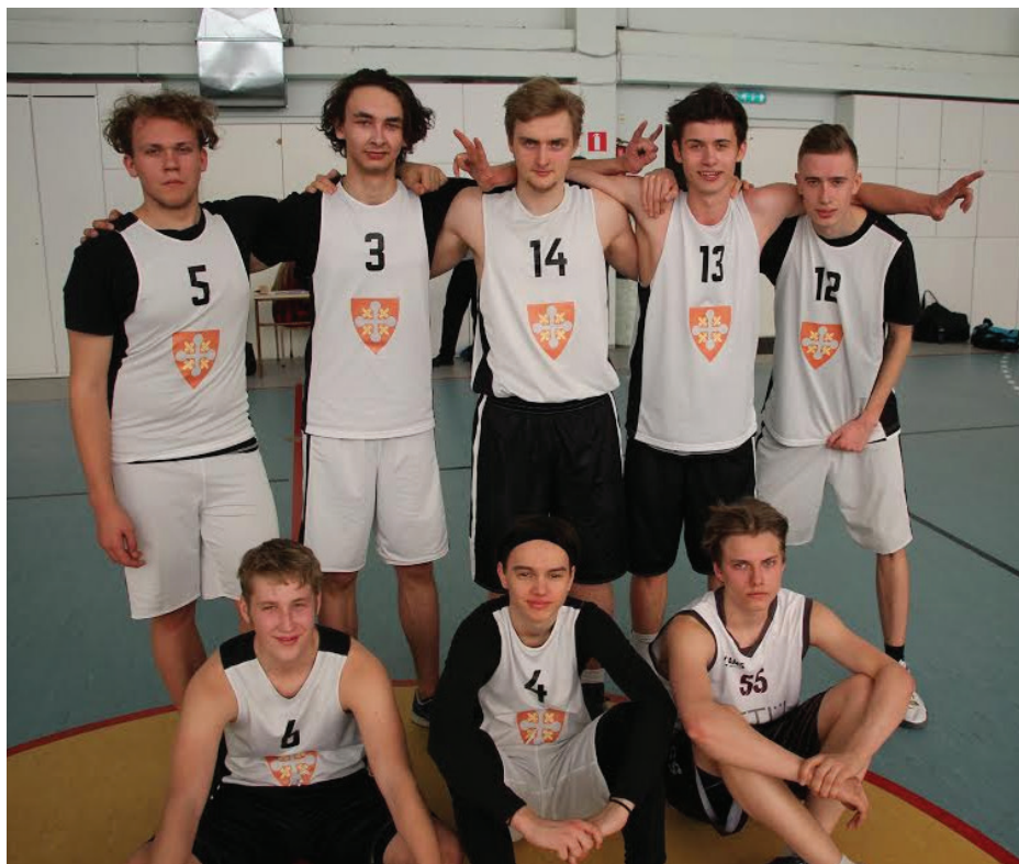
Gümnaasiumi kossupoisid finaalis