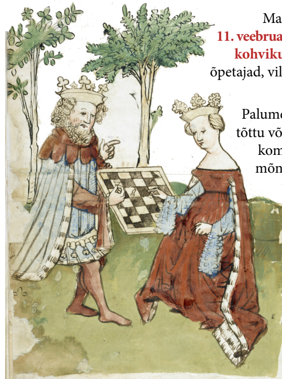
Kuningas ja kuninganna malet mängimas. Saksamaa, 15. sajand

Oleme seadnud endale eesmärgiks taaselustada aktiivset huvi male, kuningate mängu vastu ja koondada igas vanuses VHK-lasi seda mängu harrastama.