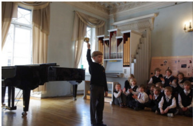
Fotokroonika: viimane koolikell