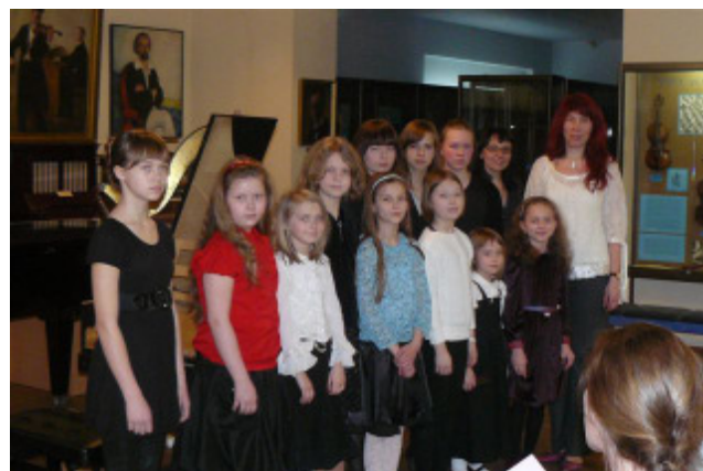
Sellid ja õpipoisid