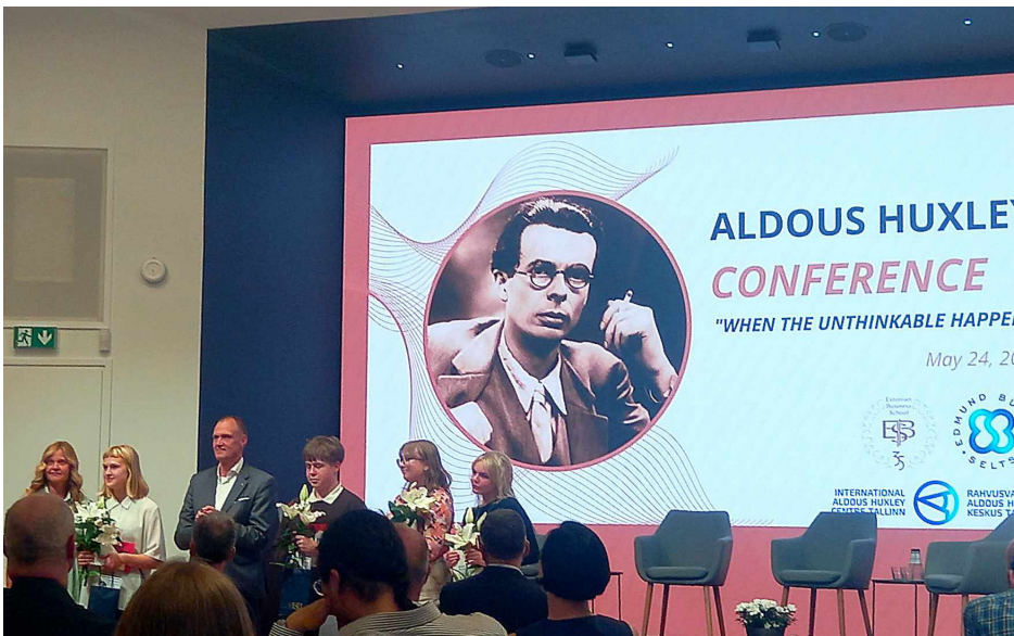
Essee konkursi võitjate tunnustamine Aldous Huxley konverentsil

– Vaimulik rahvaviis „Ma olen maa peal võõras“, sõnad: Paul Gerhardt.