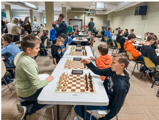
Hetk enne viimast vooru