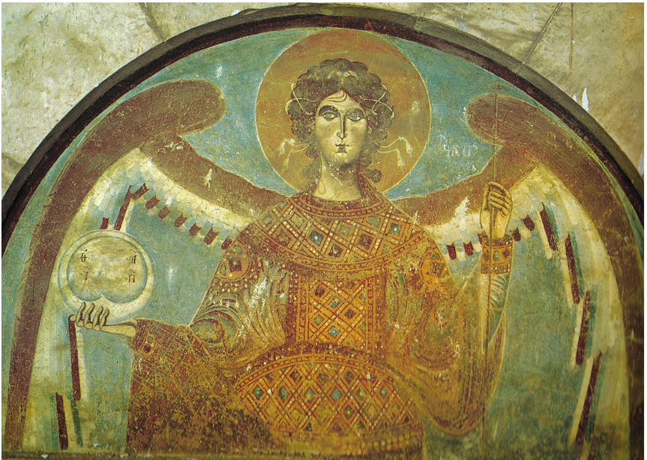
Fresko peaingel Miikaelist, Sant'Angelo in Formis, 11. sajand