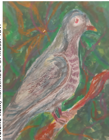
Helene Kelli, kunstikooli 5. klass. Tuvi

Okasroosikeses 3. korruse koridoris on välja pandud KEVADNÄITUS.